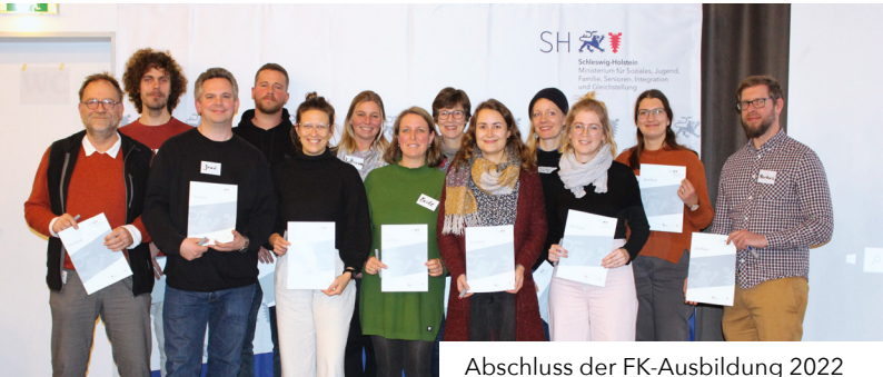
Abschluss der FK-Ausbildung 2022

Projektdokumentation bis spätestens Dezember 2024 Zertifikatsübergabe im März 2025